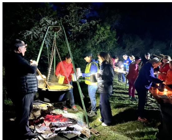
Encore un beau moment de convivialité !

Un temps clément, une musique de qualité, un parcours très plaisant, une soupe aux pois mijotée pendant quatre heures... unanimement appréciée à la cabane de chasse.