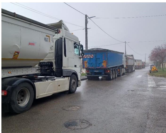
Rue de Belvédère : impressionnante attente des camions chargés d'enrobés.