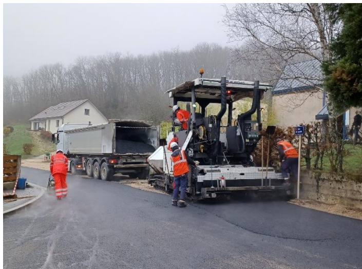
Après le chemin de la Combe, application de l'enrobé au carrefour Lucelle – Ravières

Le chantier de la rue des Fontaines qui comprend la réalisation d'un plateau-ralentisseur au droit de l'allée de la Fruitière sera mené à bien, fin avril, dès le passage de la CLASSIC CYCLISTE.