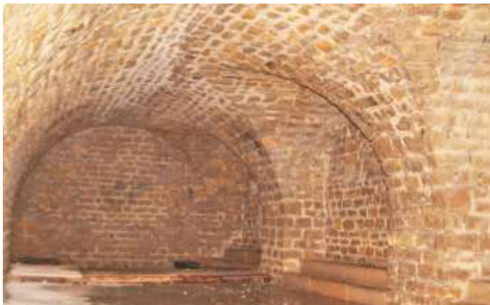
La batterie des Rattes

Attention, l'accès par véhicule à moteur n'est pas autorisé.