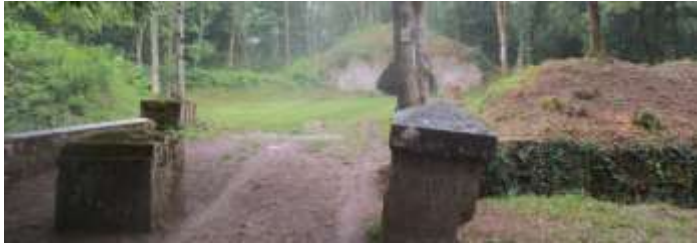
Arrivée à la batterie des Epesses

A Montfaucon, en étudiant les altitudes sur la carte au 1/25 000, on peut lire les cotes 616m (on y bâtit le fort Warol entre 1874 et 78 (ou fort Neuf), et près de 2 km plus à l'est, en limite de la commune de Gennes, au nord 578 m et à l'est 492 m (en 1883 les militaires construiront les batteries des Epesses et des Rattes. Dotées de 4 canons de 155, elles pouvaient tirer au nord et à l'Est à près de 10 km jusqu'à Marchaux, Laissey et Bouclans et même Venise.